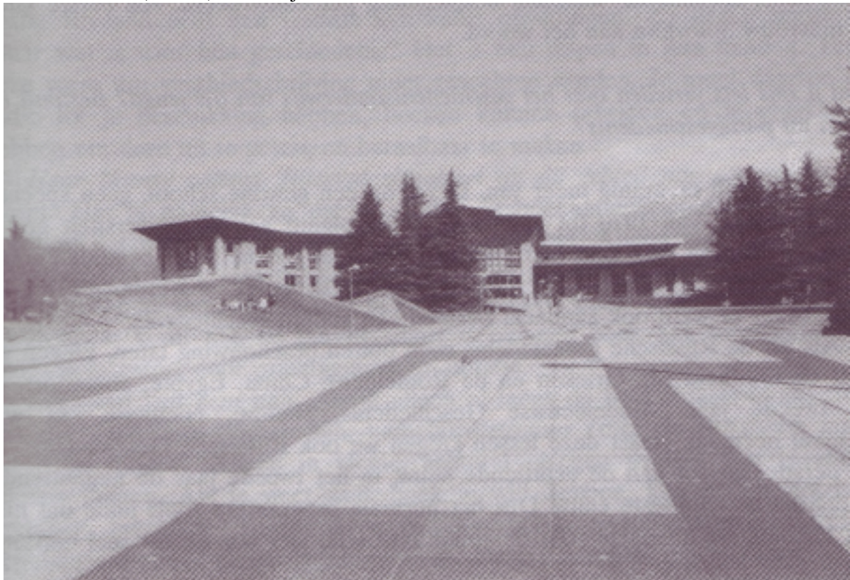
De campus van Grenoble. De bibliotheek der wetenschappen, een typisch voorbeeld van de architectuur op de campus.

Het nieuws in Le Monde , dat ik in de inleiding aanhaalde, wekt om deze redenen verontrusting op de universiteit. De druk op het universitaire stelsel neemt toe zonder dat er duidelijke perspectieven zijn voor de docenten, noch voor hen die een universitaire graad halen. Voor de 'academische' roeping is veelal te weinig geld beschikbaar, voor de 'professionele' taak zijn er te weinig banen. Dit werkt een zeker défaitisme in de hand. Dat dit een algemeen Frans verschijnsel is, moge een (schrake) troost zijn.